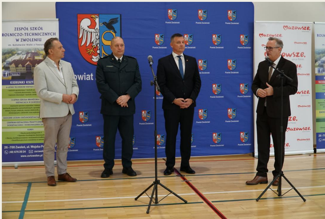
Uroczyste oddanie zmodernizowanej sali gimnastycznej w ZSRT w Zwoleniu